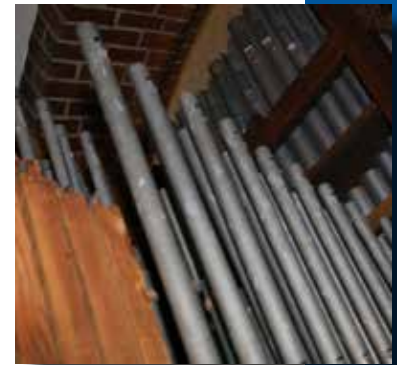
Das Innere der Orgel